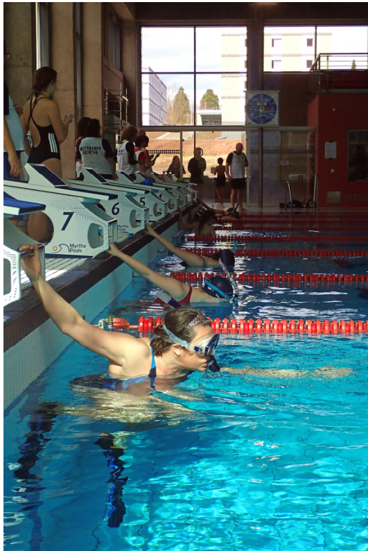
Am Start ..., Foto: Gunter Daniel

mitgemacht, organisiert und unterstützt haben und so zu diesem gelungenen Tag beigetragen haben.