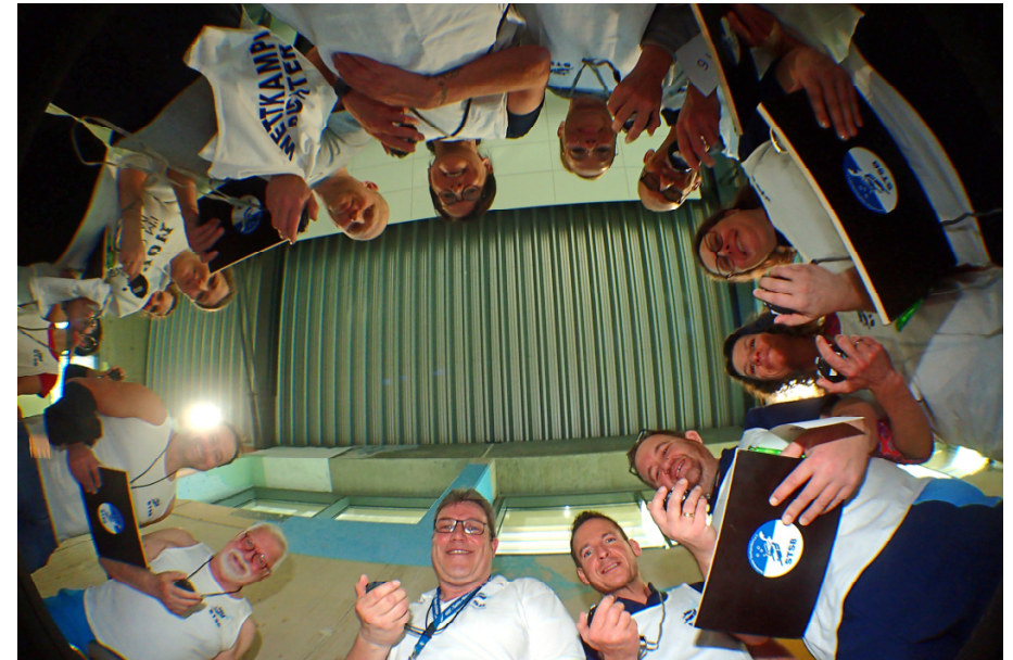
Ohne sie geht nichts: Unsere Wettkampfrichter

Ein großes Dankeschön geht an alle Helfer und Beteiligten, die