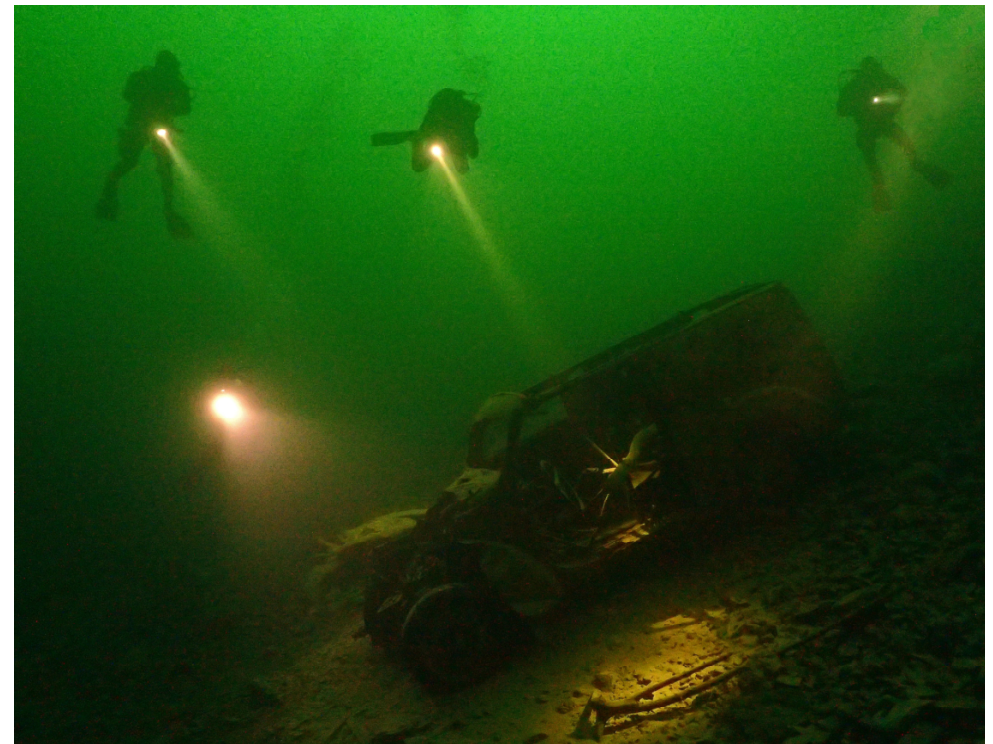
Taucher aus diversen STSB-Vereinen beim Bergseetauchen; Foto: Nick Bücklein, TC Manta

Uns so könnte ein geniales Foto ausschauen: