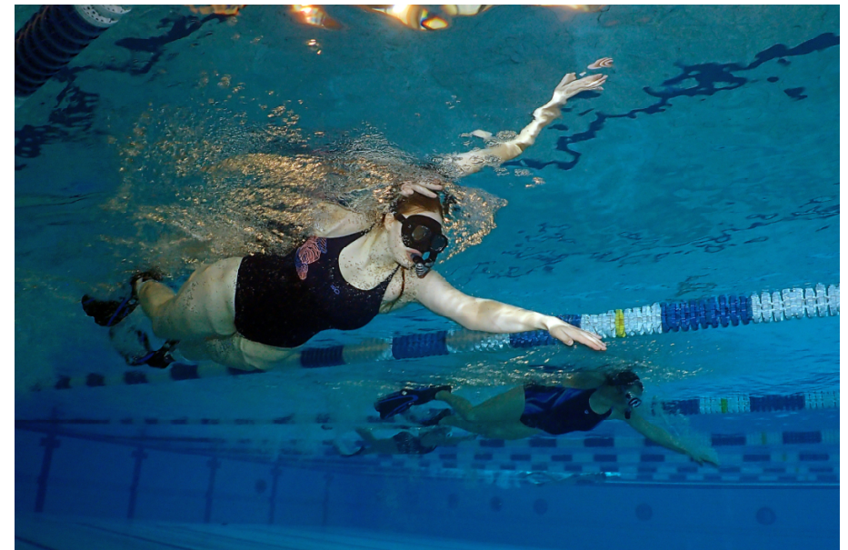
Die Damen nehmen die 800 m-Langstrecke in Angriff, Foto: Gunter Daniel